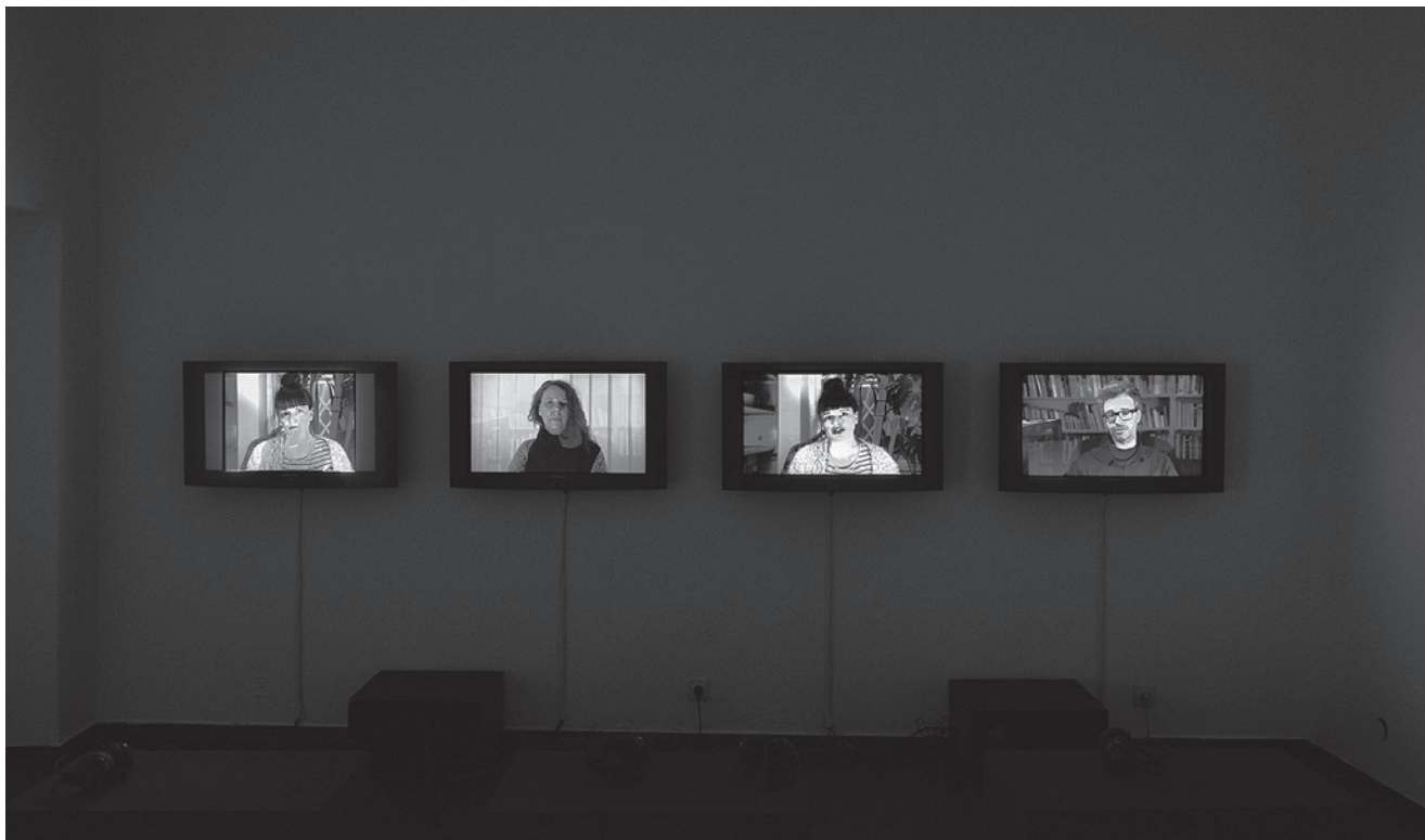
V video intervjujih so nekdanji udeleženci in udeleženke šole problematizirali pogoje delovanja v polju kuratorstva in v širšem družbenem kontekstu / In the video interviews, the former participants of the school problematised the working conditions within the field of curating as well as within the broader social context, foto / photo: Dejan Habicht

ter nevrvalgične točke, ki sva jih poskušala izpostaviti na razstavi.