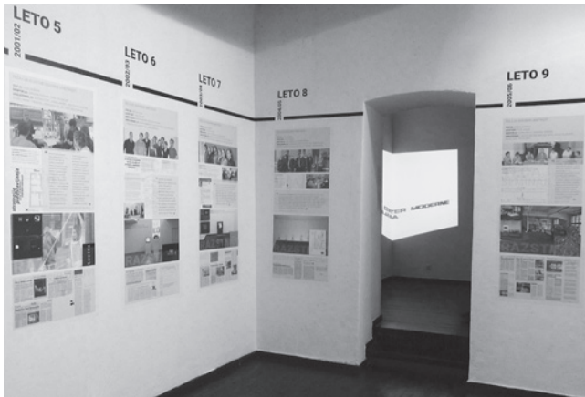
Časovnica v prvi sobi je kronološko predstavljala dvajsetletno zgodovino šole Svet umetnosti / The timeline in the first room represented the twenty-year history of the World of Art School in a linear way, foto / photo: Miha Kelemina