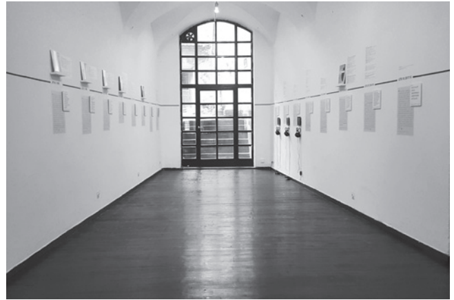
Časovnica v četrti sobi je prikazovala dvajsetletno izobraževalno kontinuiteto šole / The timeline in the fourth room showed the school's twenty-year long continuity in educational process, foto / photo: Miha Kelemina

ki lahko zaradi tekstovnosti potencialno razpadejo v neberljivost, obiskovalci in obiskovalke pa se le stežka soočajo s predstavljeno količino gradiva.