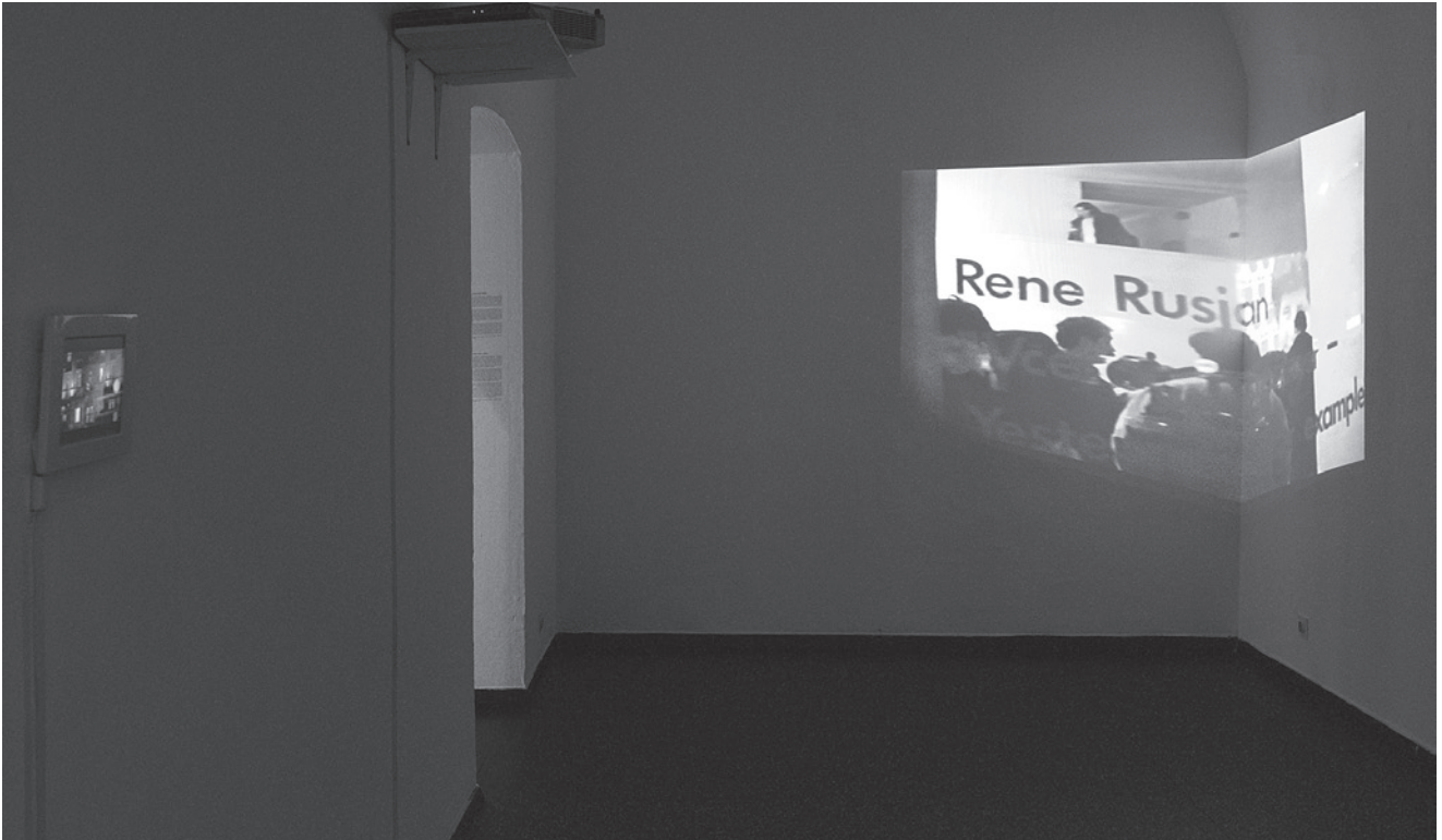
Sedanje stanje Rene Rusjan je bila celovita vnovična postavitev dela s prve razstave Sveta umetnosti leta 1997 v isti galerijski prostor / Present Situation by Rene Rusjan was a complete re-install of the artist's piece from the first World of Art exhibition in 1997 in the same gallery space, foto / photo: Dejan Habicht

postavitvi v galerijski prostor in njegovi umestitvi v sam koncept razstave. Delo je začelo nastajati leta 2016, metoda pridobivanja informacij pa je bil intervju, ki ga je umetnik opravil z akterji in akterkami 7 ljubljanske umetnostne scene. Delo je v vezje razstave vneslo nevrvalgično točko v analizi institucionalnega tkiva sistema, s svojo »nedokončanostjo« pa je kartografirala ključne dejavnike in procese znotraj umetnostnega sistema in jih preko algoritemskih fragmentov sestavljala v delne narativne sheme. Delo, ki je v izvirniku v pdf- formatu, je bilo v galeriji predstavljeno na 35 A4 listih, posamezne liste ali pa celotno shemo, pa so lahko obiskovalke in obiskovalci odnesli s seboj ter tako v skupku izjavljenega pogojno povzročili zev.