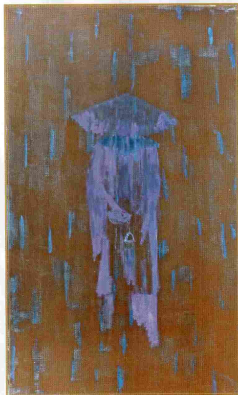
Andrej Brumen Čop: Slepa miš X (Berač), 2007, pigmenti, klej, olje in vosek na platnu, 170 x 100 cm

Razstava je na ogled do 3. marca 2012, od 9.00 do 13.00 in od 15.30 do 19.00.