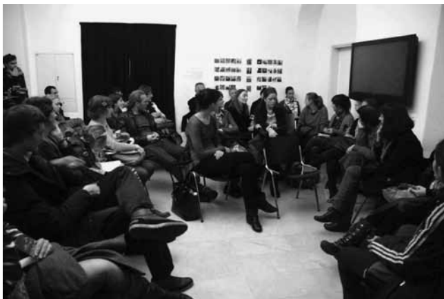
Pogovor ob zaključku razstavnega projekta Video obrat / A conversation about the exhibition project Video Turn , 2012, Galerija Vžigalica / Vžigalica Gallery, Ljubljana, foto / photo: Jasna Jernejšek