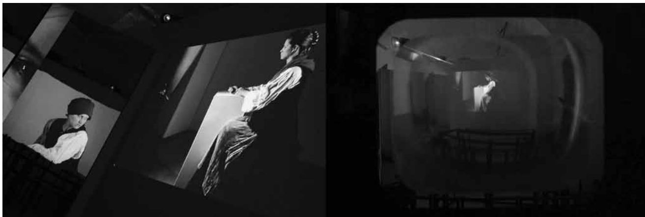
Miha Vipotnik v sodelovanju s Sergejem Kapusom in študenti ALUO / Miha Vipotnik in cooperation with Sergej Kapus and the students of Academy of Fine Arts and Design, Doma (J. Petkovšek) / Home (J Petkovšek) , 2012, detalj / detail, Galerija Vžigalica / Vžigalica Gallery, Ljubljana