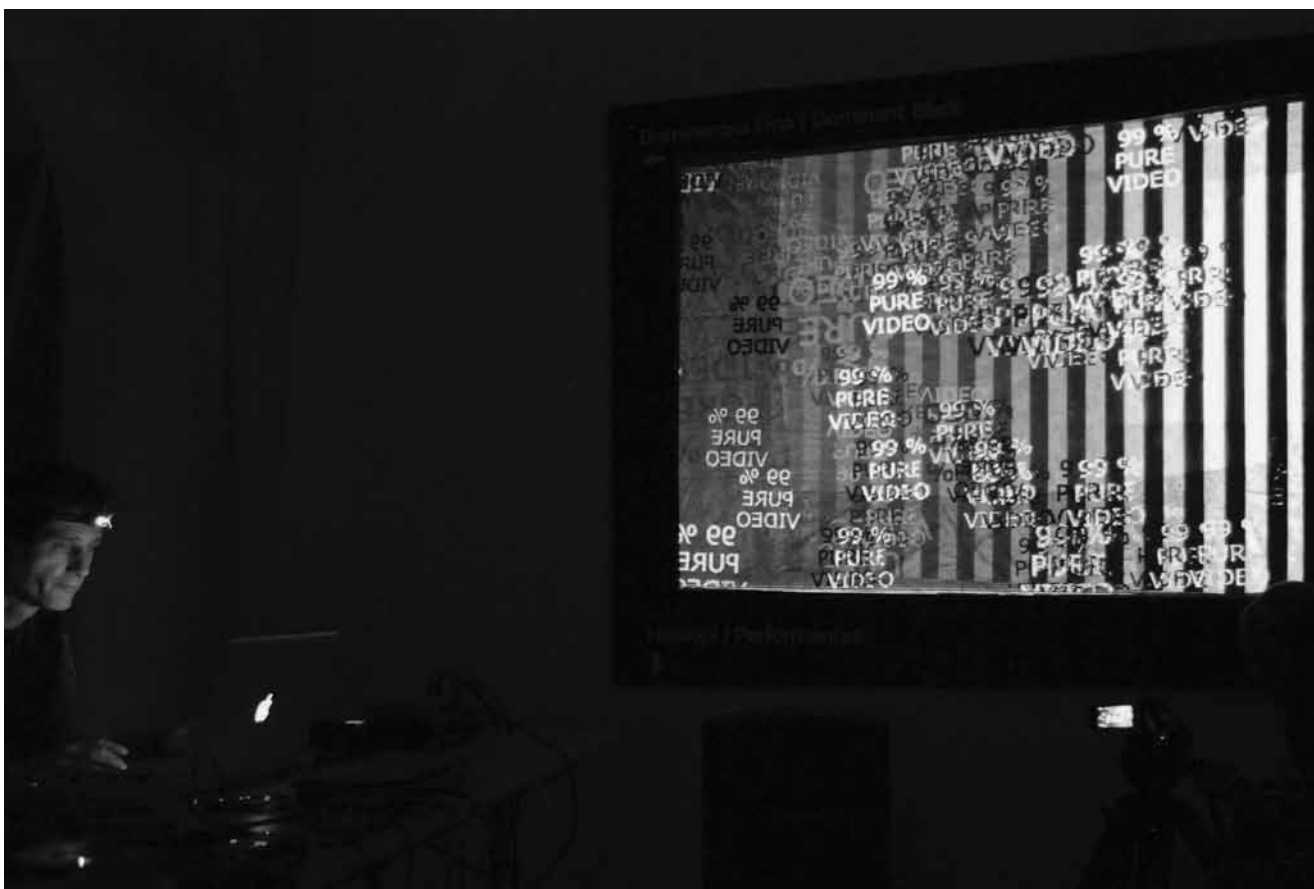
Neven Korda, SZ od JV / NW from SE , 2012, agitacijski performans / agitation performance, Galerija Vžigalica / Vžigalica Gallery, Ljubljana

Eksperiment v umetnosti postane s pojavom modernizma prevladujoča oblika metodološkega delovanja, ki svoj vrhunec doživi v avantgardi, zaradi katere se spremeni dotedanja umetniška paradigma in v okviru katere umetnost izstopi iz obstoječih estetskih okvirjev.