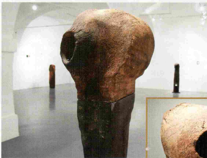
Kovano železo in terakota, 2011 (detajl)