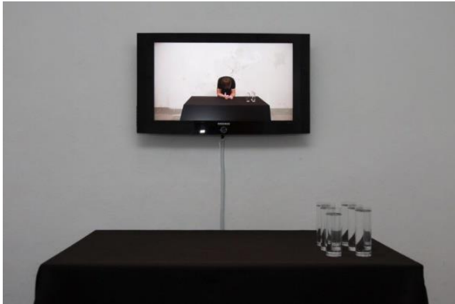
Foto: postavitve v galeriji Škuc

Posnetek performansa: umetnica z mize vzame poln kozarec vode, ga vztrajno drži v iztegnjeni desnici, dokler dejavnost ne postane fizično neznosna, in ga nato poskusi položiti nazaj na podlago. S ciljem, da kozarec ostane nerazbit, cel in količina vode v njem enaka, dejavnost izvede znova in znova – večkrat neuspešno, vse dokler ne uskladi svojih pričakovanj in dejanskih fizičnih sposobnosti ter kozarec končno obstoji na mizi tak, kot je bil z nje tudi vzet.