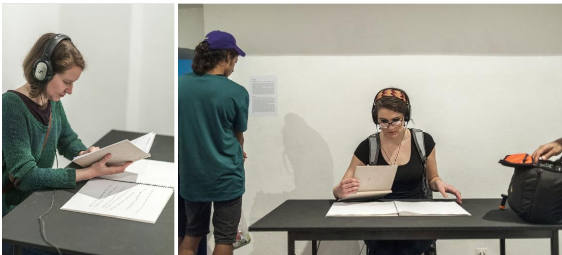
Foto: postavitve v galeriji Škuc, 2016

Osnova umetniškega projekta eksperimentalne narave je bila namerno ustvarjena desetdnevna slepota. Del projekta je bilo ustvarjanje portretov v glini (po spominu, prek dotikanja in tipne zaznave sicer umetnici neznane osebe, na podlagi zvočnega posnetka osebe, ki je opisovala svoj izgled), risbe ter besedila dnevniške narave (skice, zapisi, avdio posnetki).