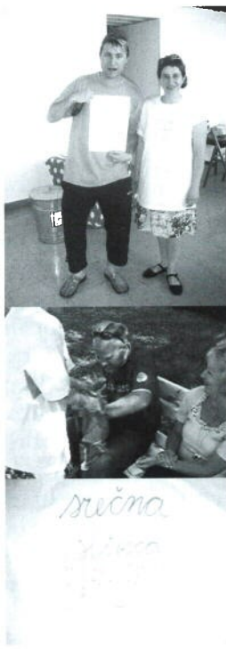
Manja Vadla, Srečna srečka / A Lucky raffle ticket , 2005

K izpostavitvi teh ključnih identifikacijskih točk manifestacije Vstop prost dodajam še eno – Vstop prost kot točka možnosti – odprta sedanjemu trenutku. V kon-