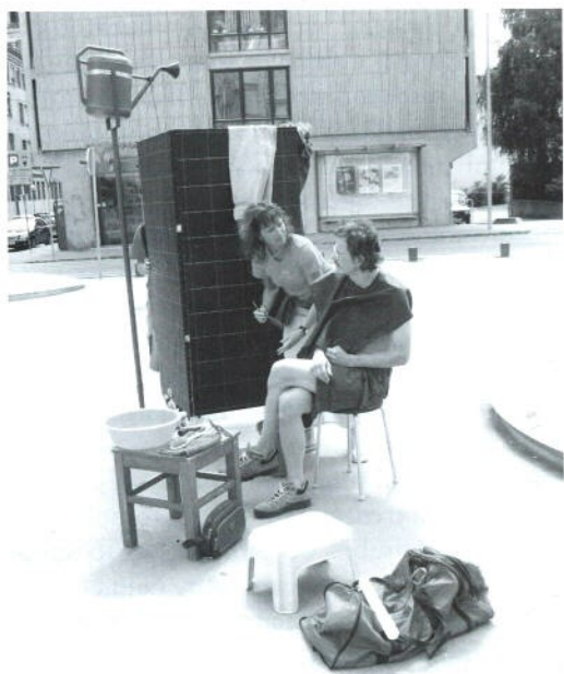
Boris Oblišar, Kopalnica / The bathroom , 2004