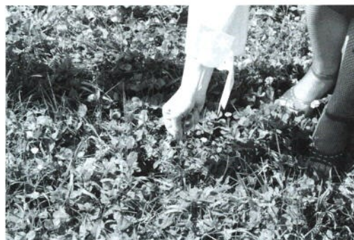
1. Andreja Džakušič, Celje, moje mesto / Celje, my town , 2005

Relacija med umetnicami/umetniki, mestom in publiko se artikulira skozi različne načine in z uporabo raz-