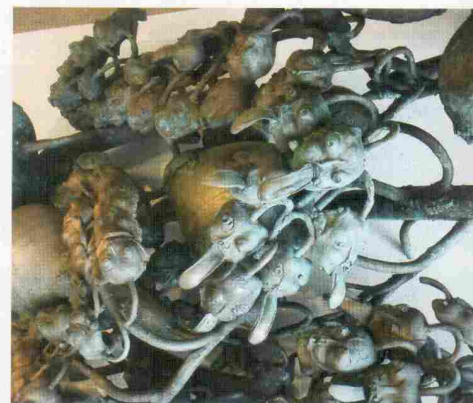
Mi, vi, oni , 10. stol. pr. n. št., bron

Razstava bo na ogled do 13. julija 2012.