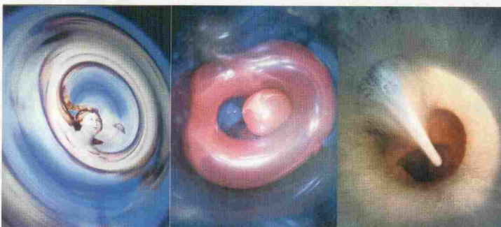
Suha beseda , Vlažna beseda , fotografija, 2009–12 (detajli)

ukriveni žebelji, ki spominjajo na izvrtine črvov in mučenje. Pred kipom je klečalnik, v katerega obiskovalec poklekne in ga gleda. Telo nima ne prepoznavnih rok, ne stopal, niti glave. Gledalec se pred kipom odloča, ali je zanj to simbol Kristusa, saj nanj spominja le podobna drža, ali prav nasprotno.